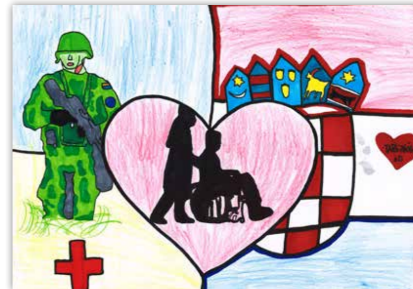
Tara Peček , 5.d / Osnovna škola Ksavera Šandora Gjalskog Zabok