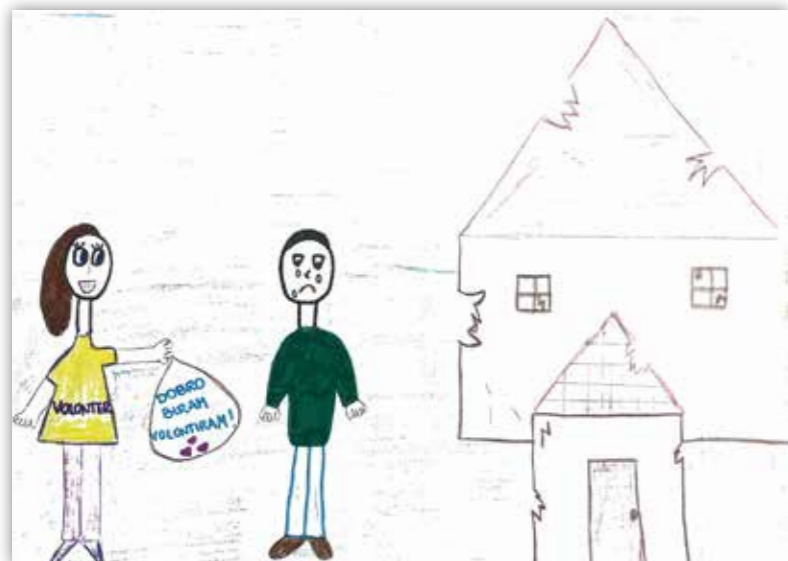
Matej Antolić, 7.a / Osnovna škola Đure Prejca Desinić